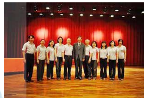
99.07 江校長於歡送茶會與同仁們合影