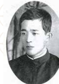
摘自本校農林學校時期第3回畢業紀念冊