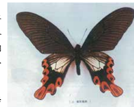
寬尾鳳蝶，摘自《宜蘭第一》189頁 吳永華提供圖片