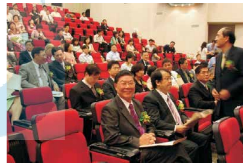
95.08.01 江彰吉校長於教育部參加交接布達典禮