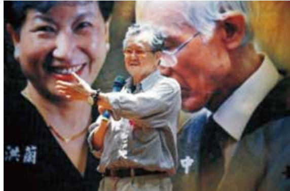
黃春明教授於宜大分享人生經歷