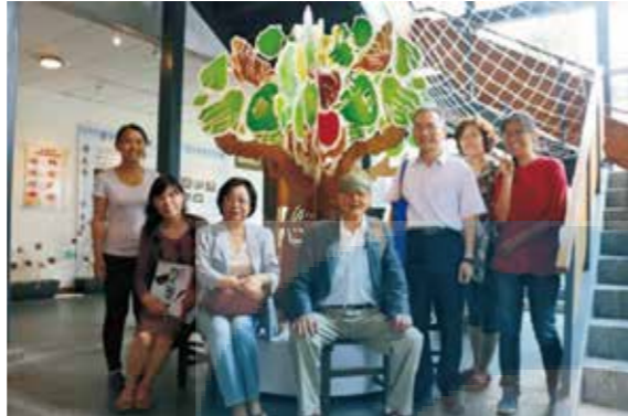
宜蘭大學教學卓越連 7 年獲獎助，作家黃春明創作「百果樹」做為賀禮