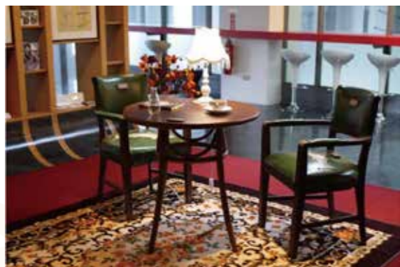
經典重現：明星咖啡館桌椅

部分撕畫作品結合 AR 技術，觀眾用手機掃描撕畫作品，就會呈現出一小段故事內容，讓參觀者彷彿置身故事情境，至於作家虛擬影像寫真館，則引導大家走入黃教授的書房，站在拍攝鏡頭前，便能看見螢幕中黃教授揮手送客虛擬影像。