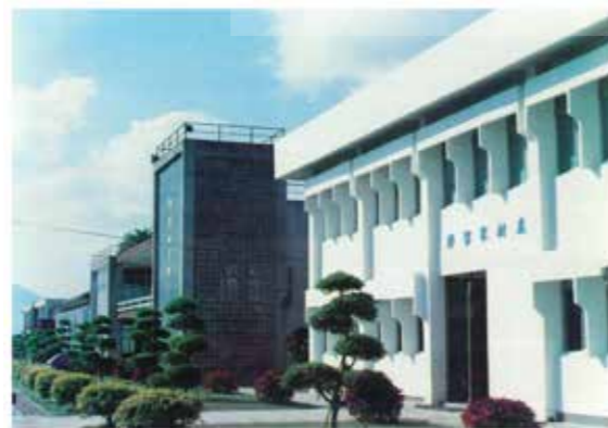
農村家事科館、食品加工科館（即求真樓） 及森林科館