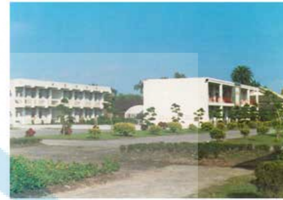
森林科及畜牧科館