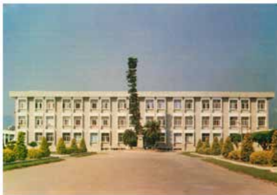
農工時期的行政大樓