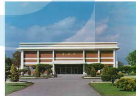
農工職校時期中正堂正面（專科以後改名為 學生活動中心）