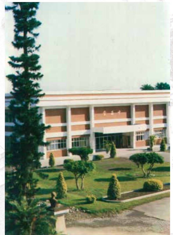
中正堂及小葉南洋杉