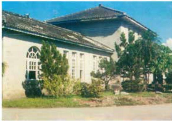
光復初期的行政大樓