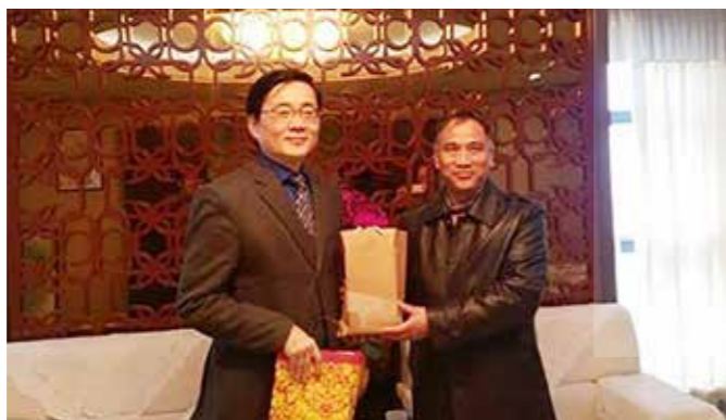
趙教授獲福建工程學院蔣新華校長頒發建校 119 年以來第一個兼職講座教授

曾為本校資工所、電子系與國立東華大學電機系合聘教授，北京交通大學、蘭州大學、廈門大學、煙臺大學、上海理工大學、上海大學、浙江師範大學、華中科大與哈爾濱工業大學兼職榮譽教授、中華民國電腦學會及臺灣國際網路學會理事長。趙教授主要研究範疇為感測元件、高速網路、無線網路、IPv6、數位藝術、綠能電腦及綠能科技。