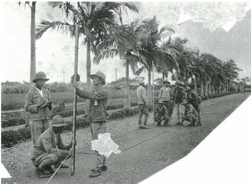
農林時期的「椰林大道」，同學正在上測量實習課，依稀可看到當時制服的樣式。