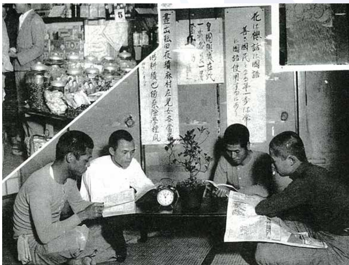
修養室內有當時的精神標語和宋代文學家范成大的田園詩，十分醒目。(摘自本校農林學校時期第5回畢業紀念冊)