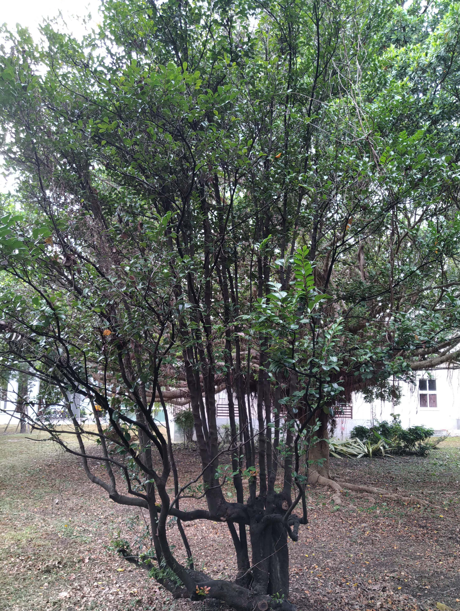
象牙樹現狀 (109年9月攝)