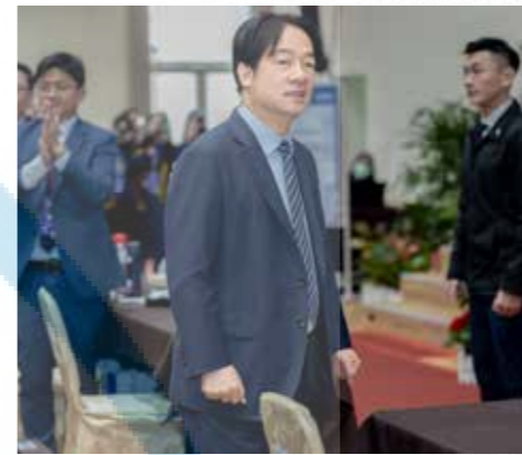
全體來賓歡迎賴總統進場