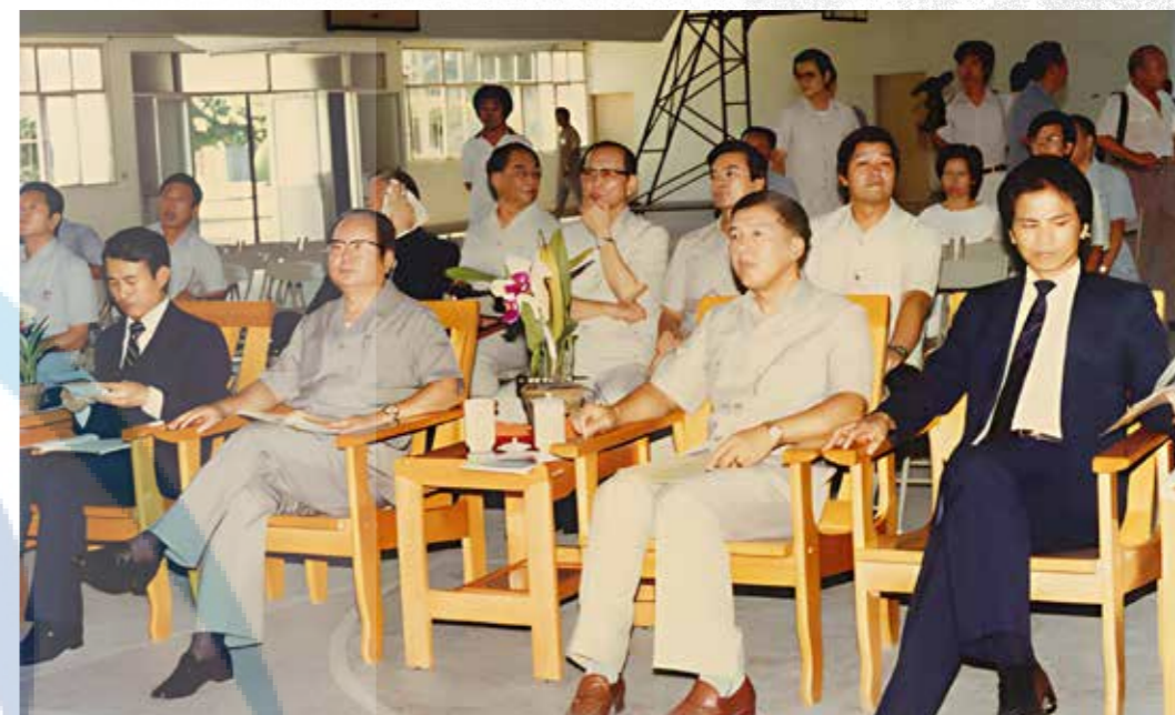
左起：陳定南縣長、邱創煥主席、陳泊汾省議員與游錫堃省議員。

邱主席巡視本校，同意補助興建林場橋樑經費 150 萬元，並在中正堂旁親植柏樹一株留念。