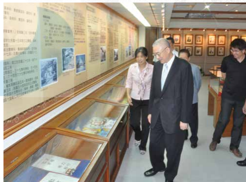
吳敦義副總統參觀本校圖資館 6 樓的校史館