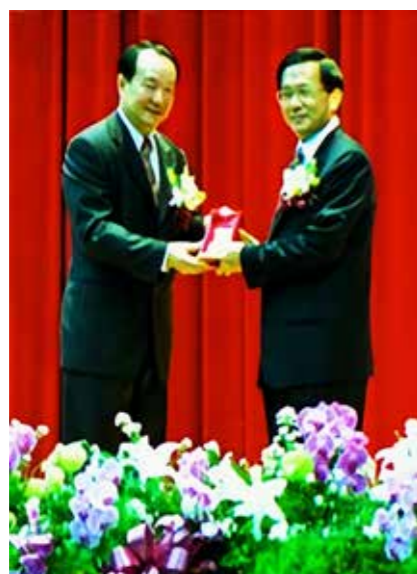
陳水扁總統致贈劉瑞生校長紀念品