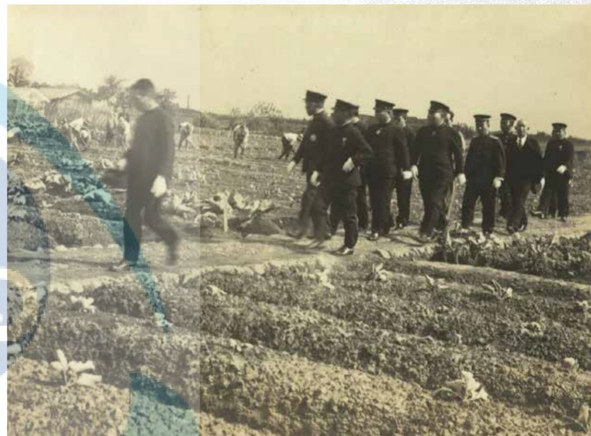
長谷川總督視察本校農場作業情形