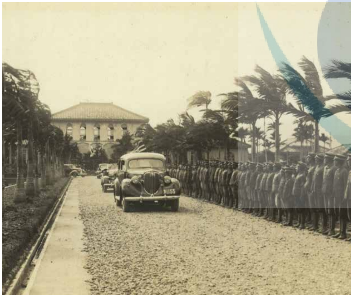
長谷川總督視察本校校門前列隊情形 （摘自中央研究院臺灣史研究所臺灣史檔案資源系統。長谷川清，視察寫真冊五）

民國 15 年（大正 15 年）9 月 1 日第 11 任上山滿之進總督到訪，校方至車站迎接上山總督，下午 2 點來校巡視。民國 17 年（昭和 3 年）10 月 7 日第 12 任川村竹治總督巡視本校，校方在車站及校門口列隊歡迎，總督在本校視察約 15 分鐘。民國 18 年（昭和 4 年）10 月 2 日舉行第 1 屆運動會，第 13 任石塚英藏總督到校巡視。