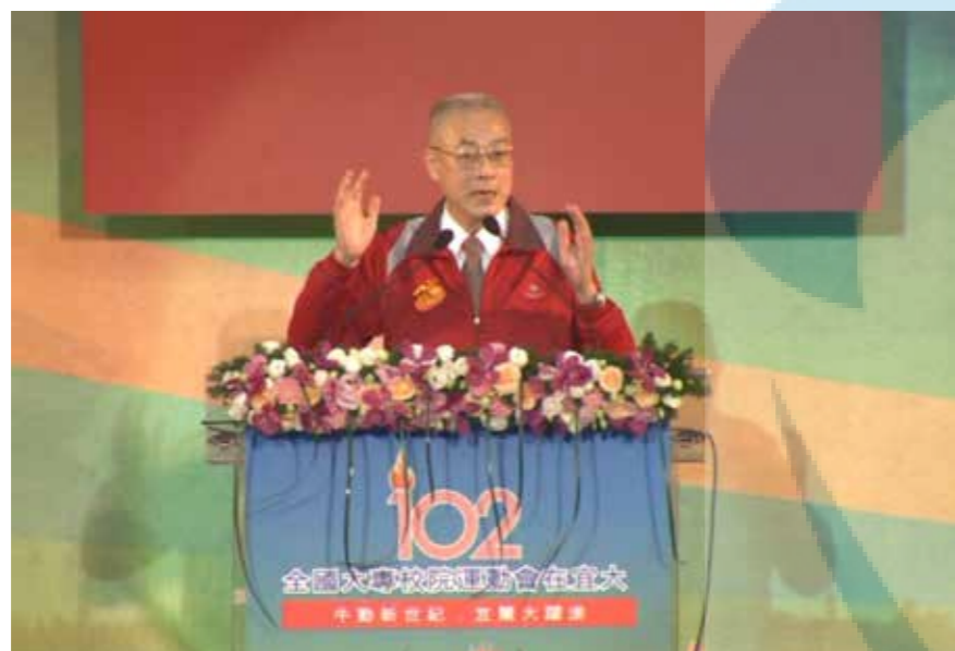
吳敦義副總統於開幕典禮致詞

本校主辦 102 年全國大專校院運動會，4 月 27 日吳敦義副總統蒞校主持開幕典禮時，以「宜文宜武、蘭桂飄香、涵仁育智、捷報頻傳」十六字賀詞祝賀大會順利，他更指出，在宜大升格將滿 10 週年當前，宜大主辦全大運別具意義。