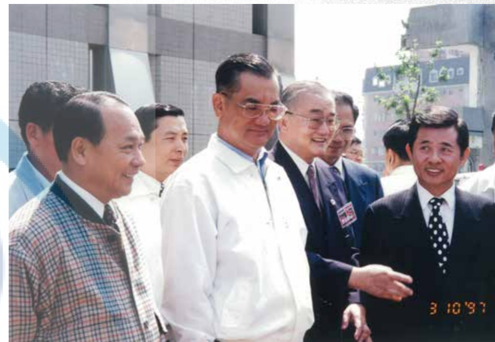
左起：林建榮立委、連戰副總統、曹以松校長、楊吉雄立委。

民國 86 年 3 月 10 日，副總統兼任行政院長連戰率領副院長徐立德、內政部長林豐正、教育部次長李建興等官員第二次蒞校，正式宣布本校將於八十七學年度改制為技術學院。