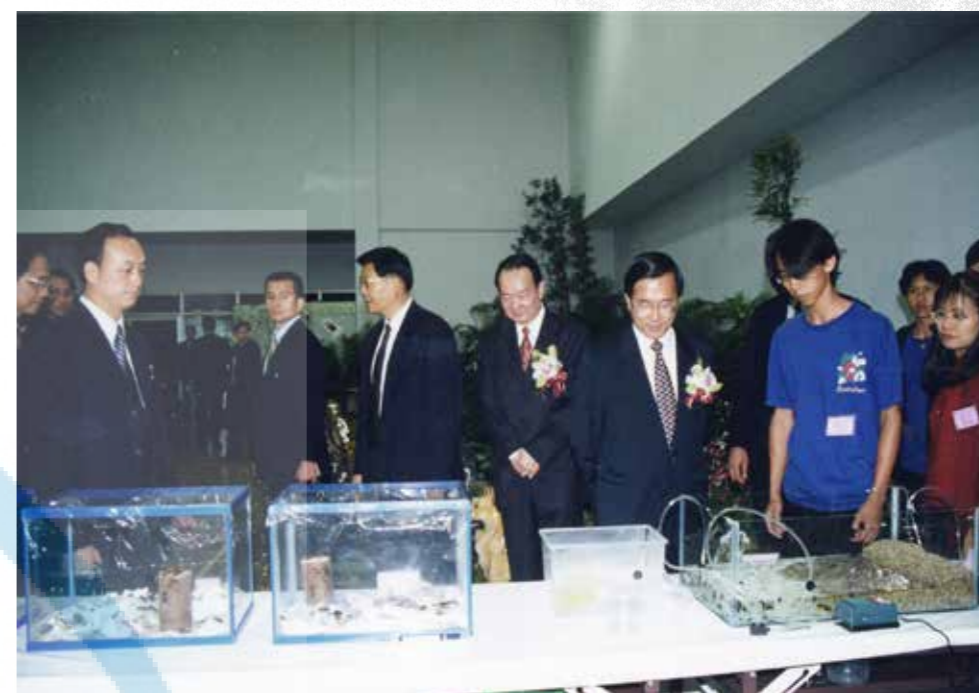
陳水扁總統參觀學生實習成果展