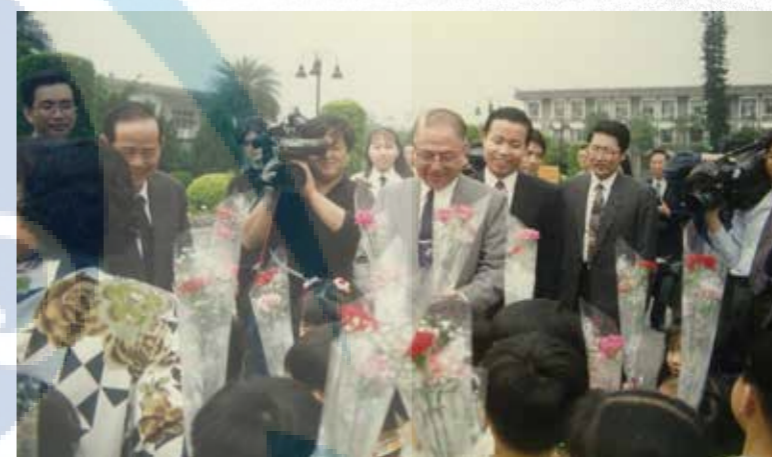
本校附設托兒所小朋友向林院長（中）獻花