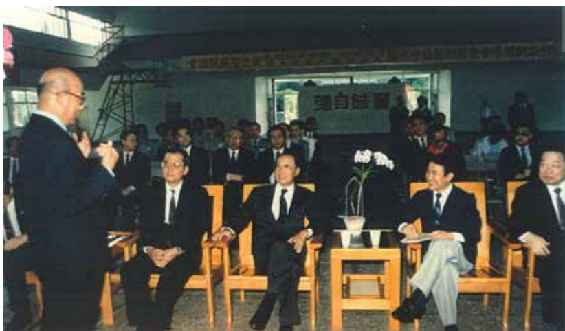
左起：于延文校長、連戰部長、俞國華院長、陳定南縣長，聽取校務簡報。