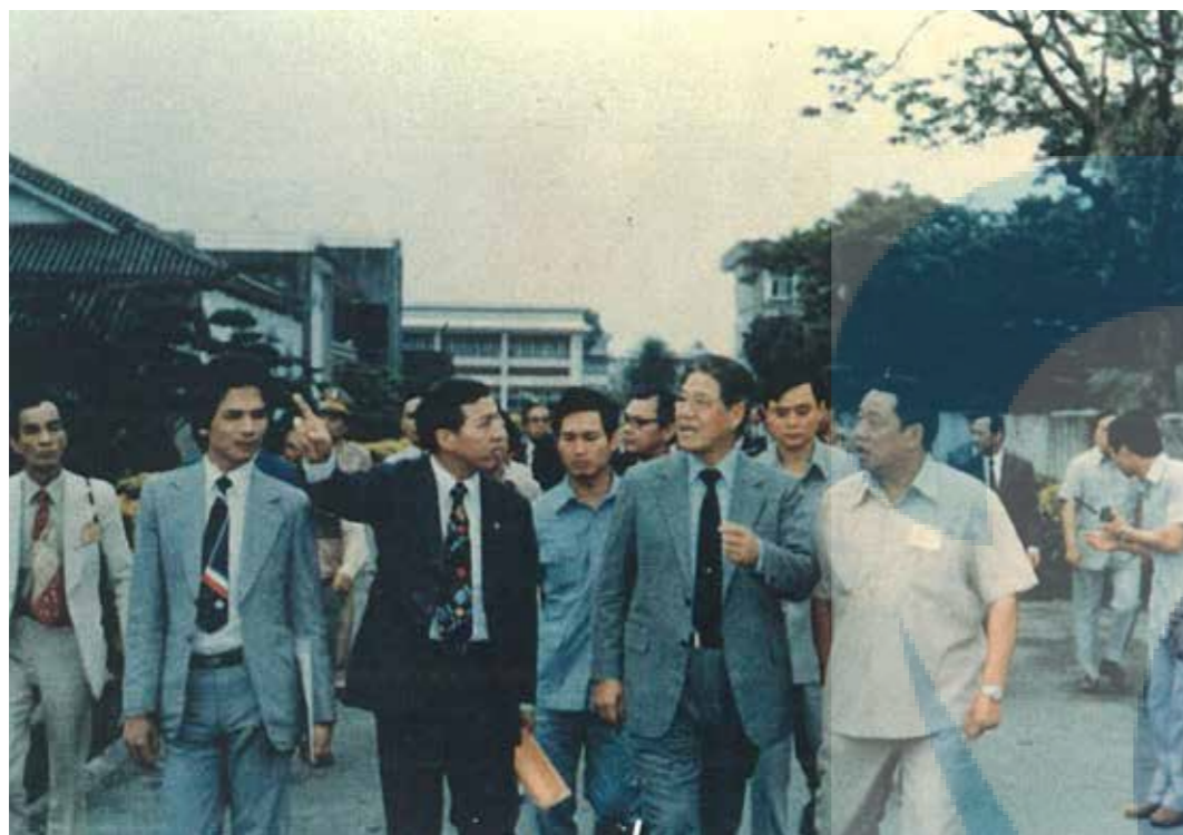
嚴大燦校長陪同李登輝主席巡視校區，前排右起：嚴校長、李登輝主席、陳泊汾省議員及游錫堃省議員。