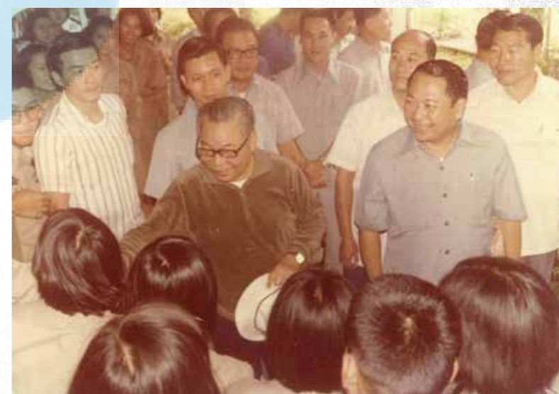
蔣總統與學生們握手寒暄，展現親和力。