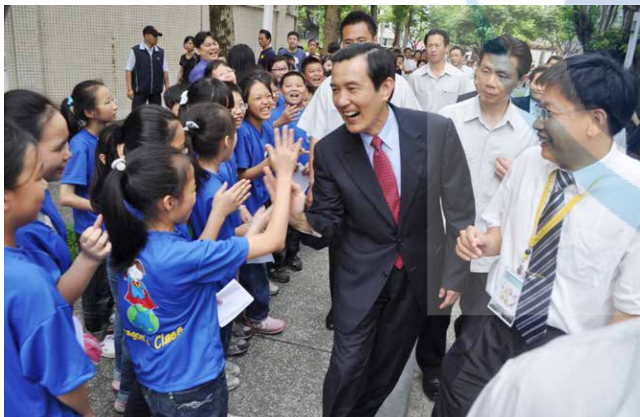
馬英九總統開心和參觀校慶展的小學生們擊掌打招呼，右一為邱奕志學務長。

當日馬總統並與國寶級作家黃春明老師進行「從文創產業談稻草人集合」對談，以稻草人地景展為背景，暢談鄉土文化關懷，並接受學生提問政府推動國內文創產業。