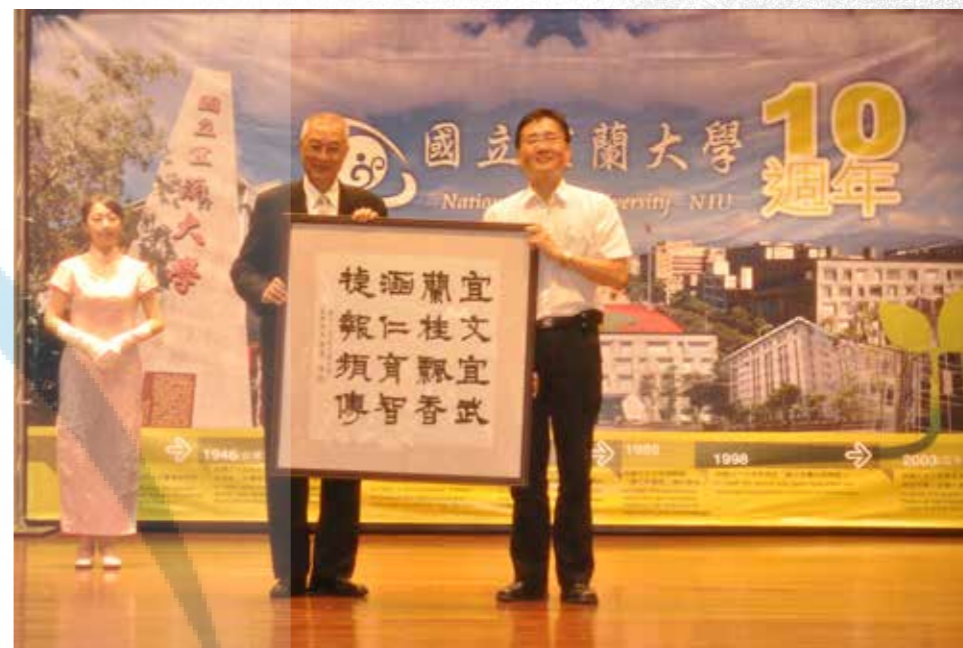
吳敦義副總統贈送「宜文宜武、蘭桂飄香、涵仁育智、捷報頻傳」16 字書法祝賀。

8 月 1 日再次出席本校升格大學 10 週年慶祝大會，親自撰寫這十六字書法並裱框，祝賀改大 10 週年。大學念歷史出身的吳副總統，並特別參觀校史館，以及在行政大樓中庭種植一株白千層樹，祝福學校繼承優良傳統，日新又新，生生不息。