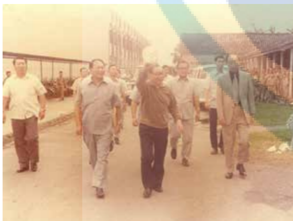
蔣總統繞行至教室區向師生揮手致意