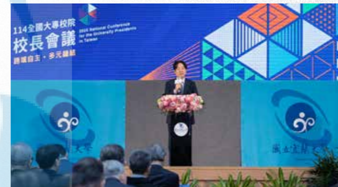
賴總統開幕致詞