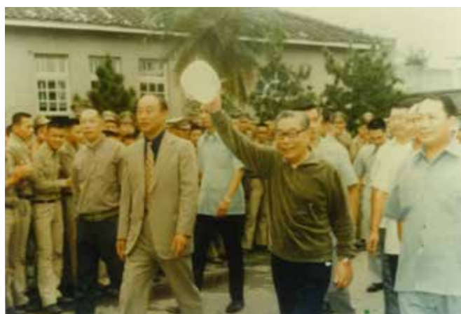
左起：巢寅相教務主任、戴華校長、蔣總統、宜蘭縣長李鳳鳴（本校校友）。

蔣經國總統當天中午搭乘直升機，在本校大操場降落。繞行至實習場、教室區，並向夾道歡迎的師生揮手致意。