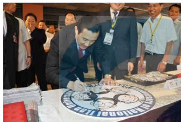
馬英九總統於 Q 版人物版上簽名