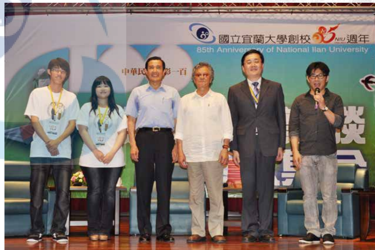
左三為馬英九總統，右三為黃春明老師，右二為趙涵捷校長。