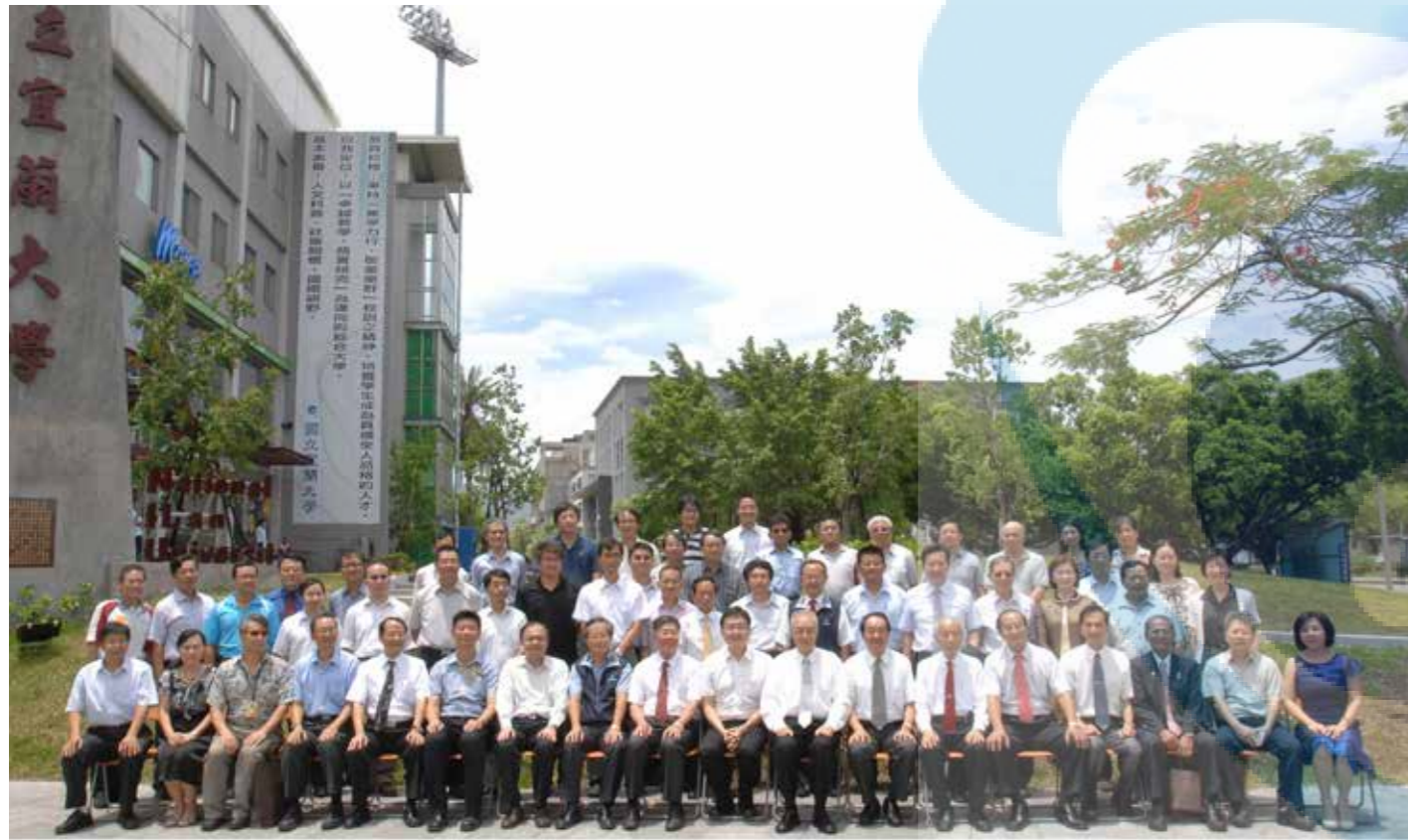
吳副總統與貴賓暨本校主管在校門前廣場合影留念

賴清德總統於 114 年 2 月 20 日出席「114 年全國大專校院校長會議」，期勉臺灣的高等教育落實教育平權，並且推動「青年百億海外圓夢基金計畫」，支持孩子走出國門追求夢想，政府會做高等教育發展的後盾，希望各大專校院與中國進行交流時能存有風險意識，保護國家核心關鍵技術和科研成果，也期盼共同努力提昇臺灣高教競爭力，為國家未來發展注入新動力。