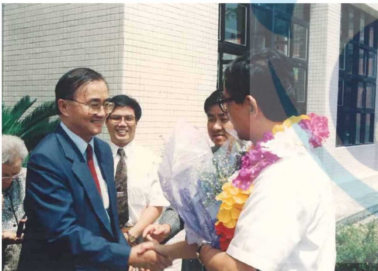
曹以松校長迎接李遠哲博士（戴花圈者）