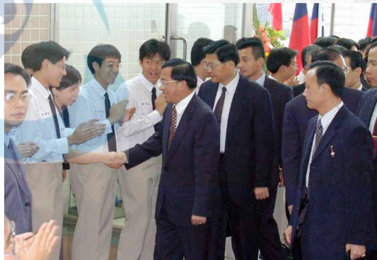
學生夾道歡迎陳水扁總統