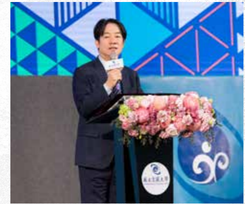
賴總統開幕致詞