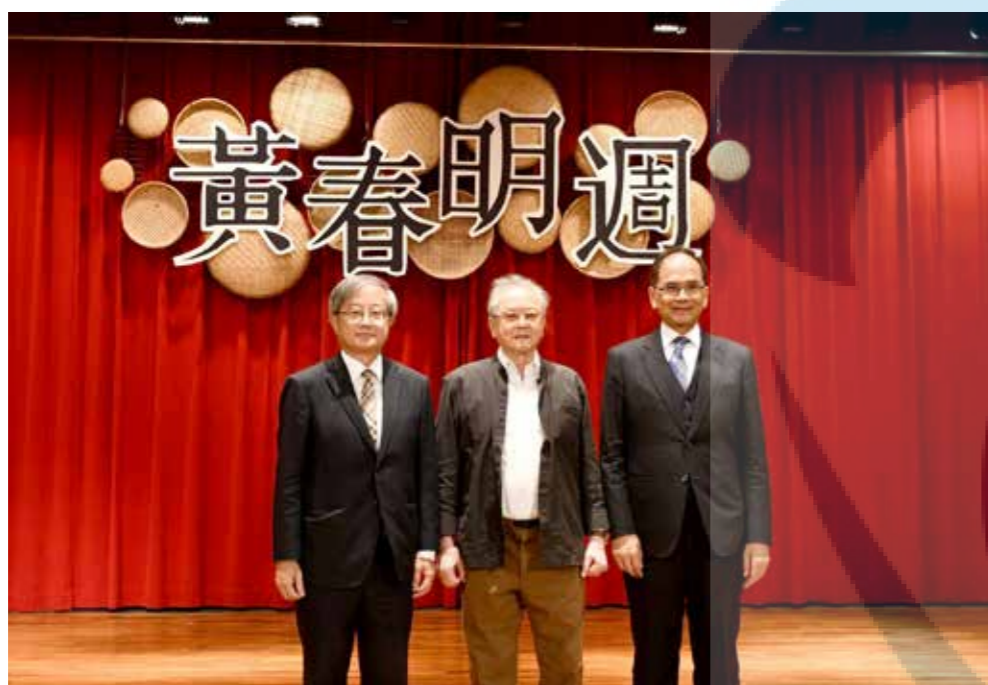
左起：吳柏青校長、黃春明老師、游錫堃院長。

本校與黃大魚文化藝術基金會舉辦「2022 黃春明週」，立法院長游錫堃以「從文化立縣談臺灣民主路」為題開講，提到其縣長任內推文化立縣，邀請黃春明老師擔任本土語言編委會召集人，閒聊兩人結緣的故事。