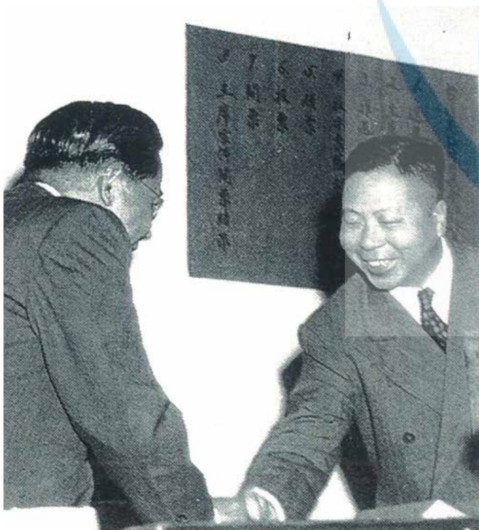
面向鏡頭者為吳國楨主席