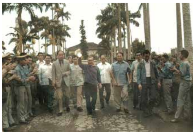
椰林大道上學生夾道歡迎蔣經國總統