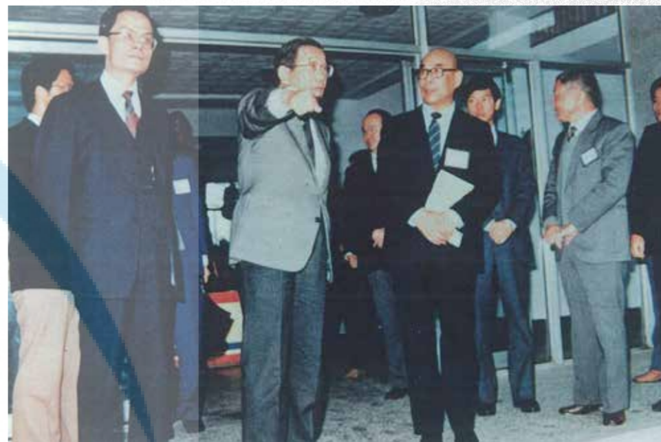
教育部長李煥（指手者）率省教育廳長林清江及技職司長楊朝祥蒞校，部長左側為于延文校長。

教育部長李煥率省教育廳長林清江及技職司長楊朝祥蒞校瞭解升格專科學校條件。返部後立即發布：宜蘭農工適宜改設專科學校。（行政院核定本校升格專科學校時，李部長已升任行政院長）