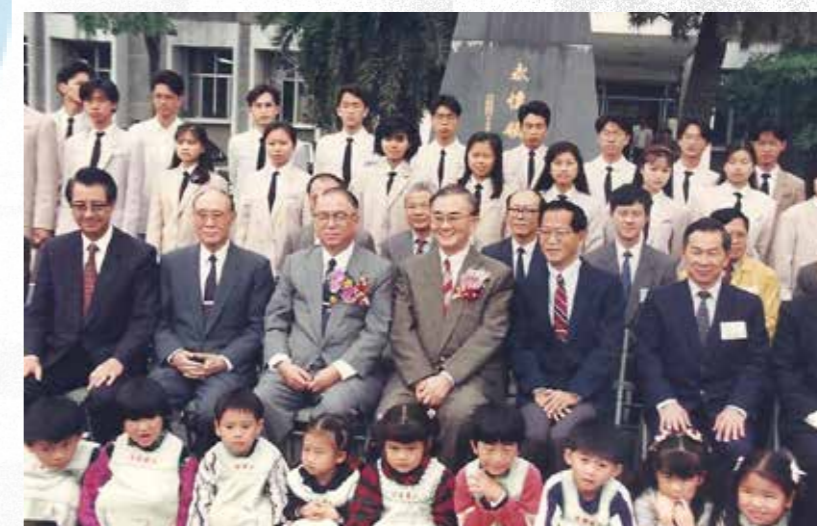
林院長（左三）、曹校長（左四）與本校師生及附設托兒所小朋友合影留念