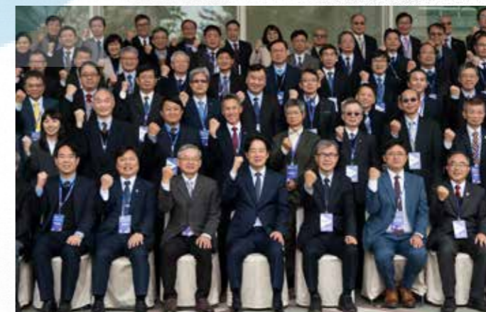
賴總統與大專校院校長合照