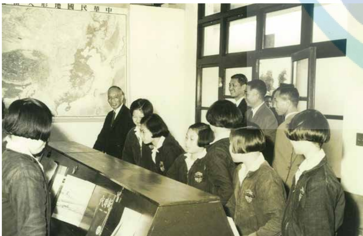
參觀圖書館閱覽室