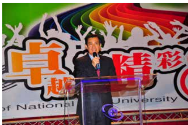
馬英九總統於慶祝大會致詞