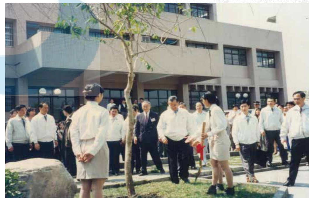
連副總統於人工湖草坪種植一株阿勃勒以為留念