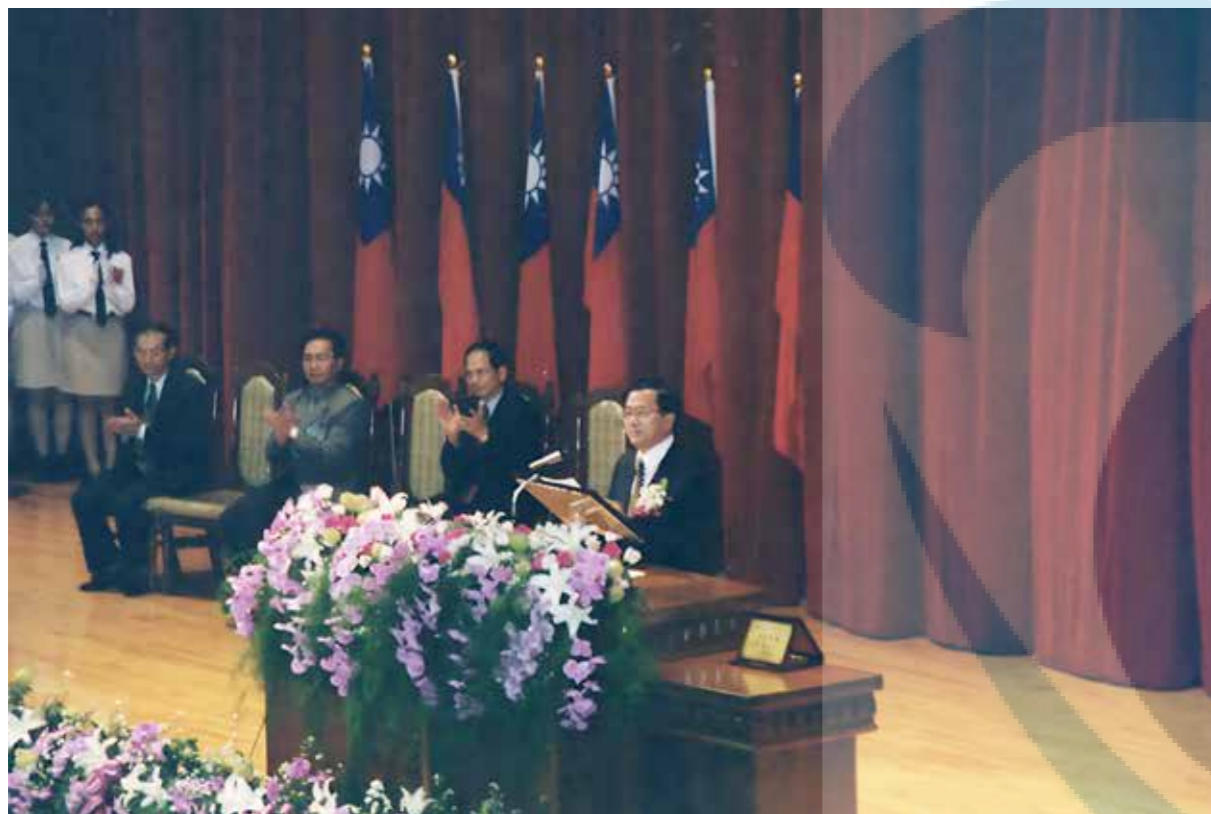
陳水扁總統蒞校演講，並祝願本校於 91 學年度順利改制為大學。

陳水扁總統蒞校演講，並祝願本校於 91 學年度順利改制為大學。會後參觀學生實習成果展，中午並與校友會理監事及本校一級主管一起用餐，餐畢搭乘下午 1 點 35 分的火車離開宜蘭。