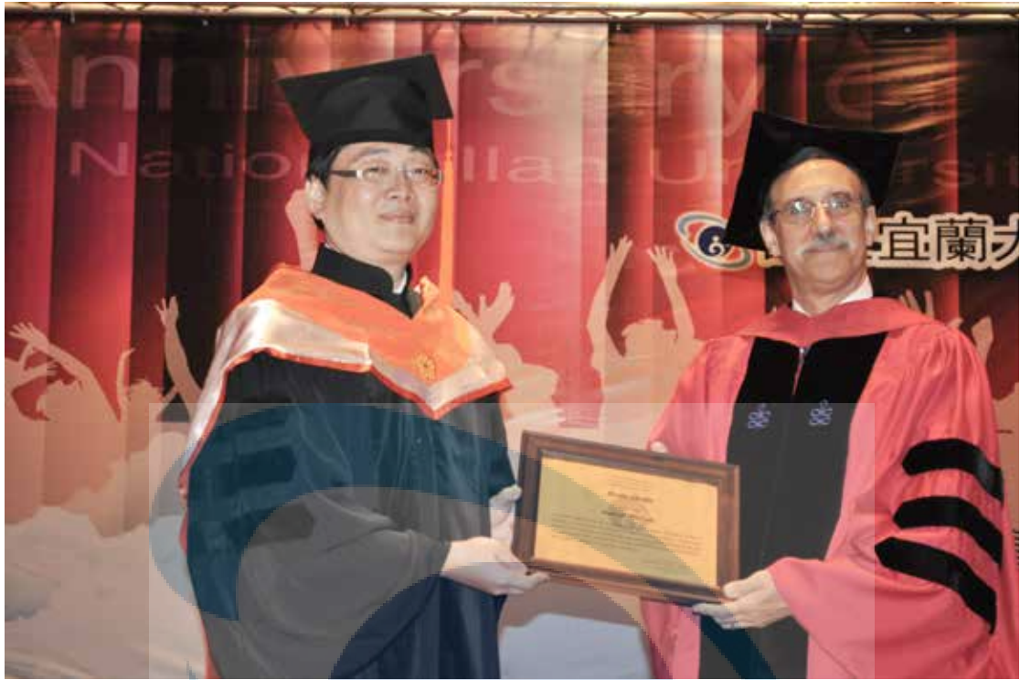
諾貝爾化學獎得主查爾菲教授（右）獲頒創校以來第一個榮譽博士學位