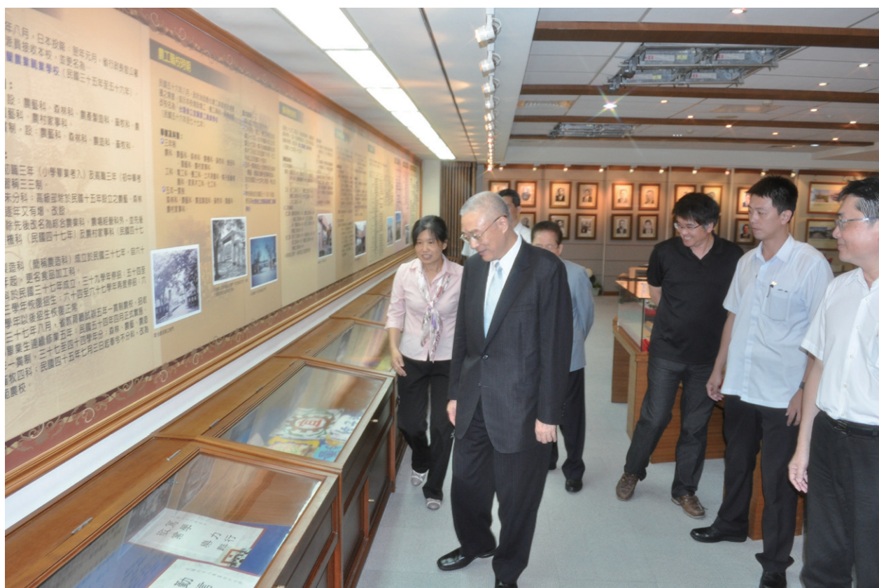
吳敦義副總統參觀本校位於圖資館 6 樓的校史館