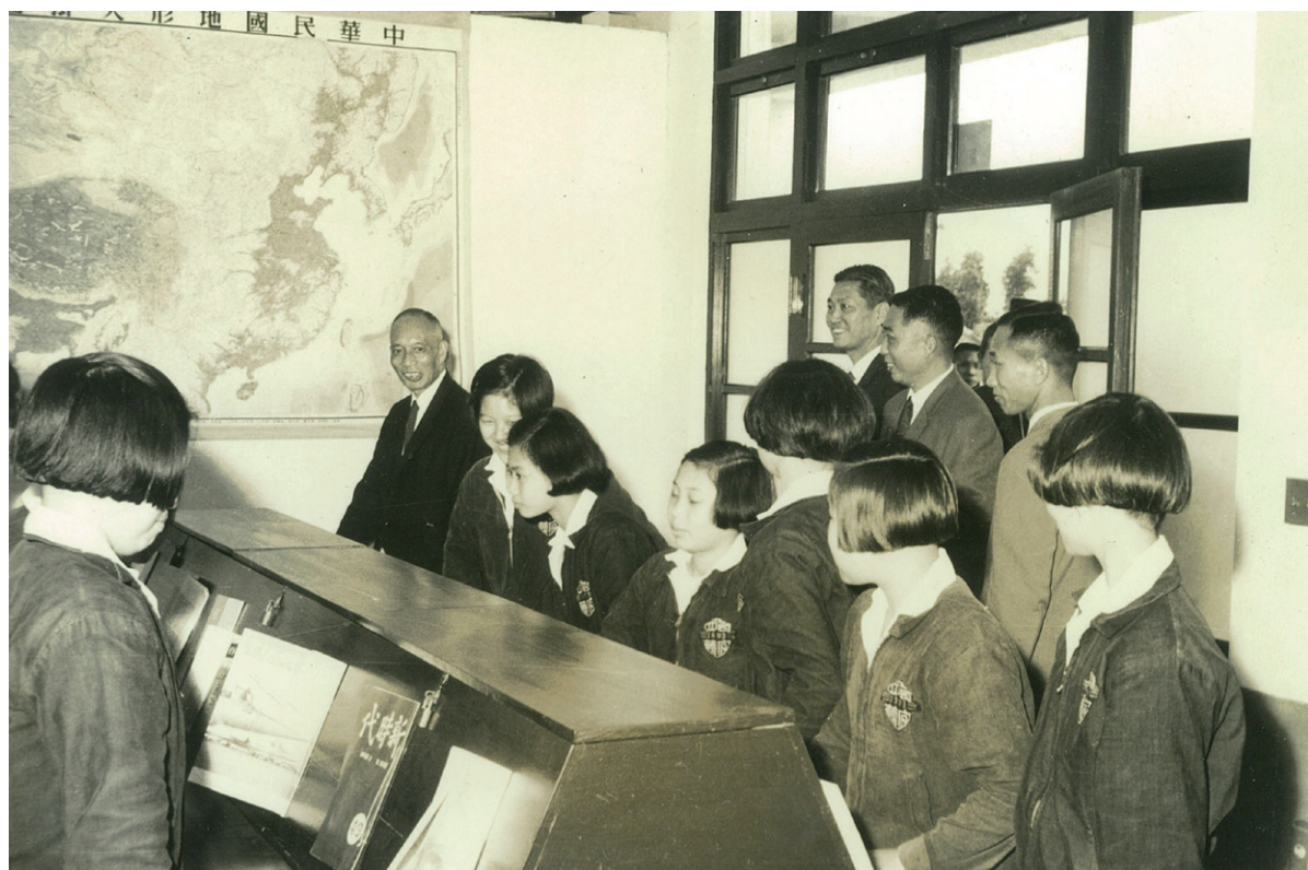
參觀圖書館閱覽室