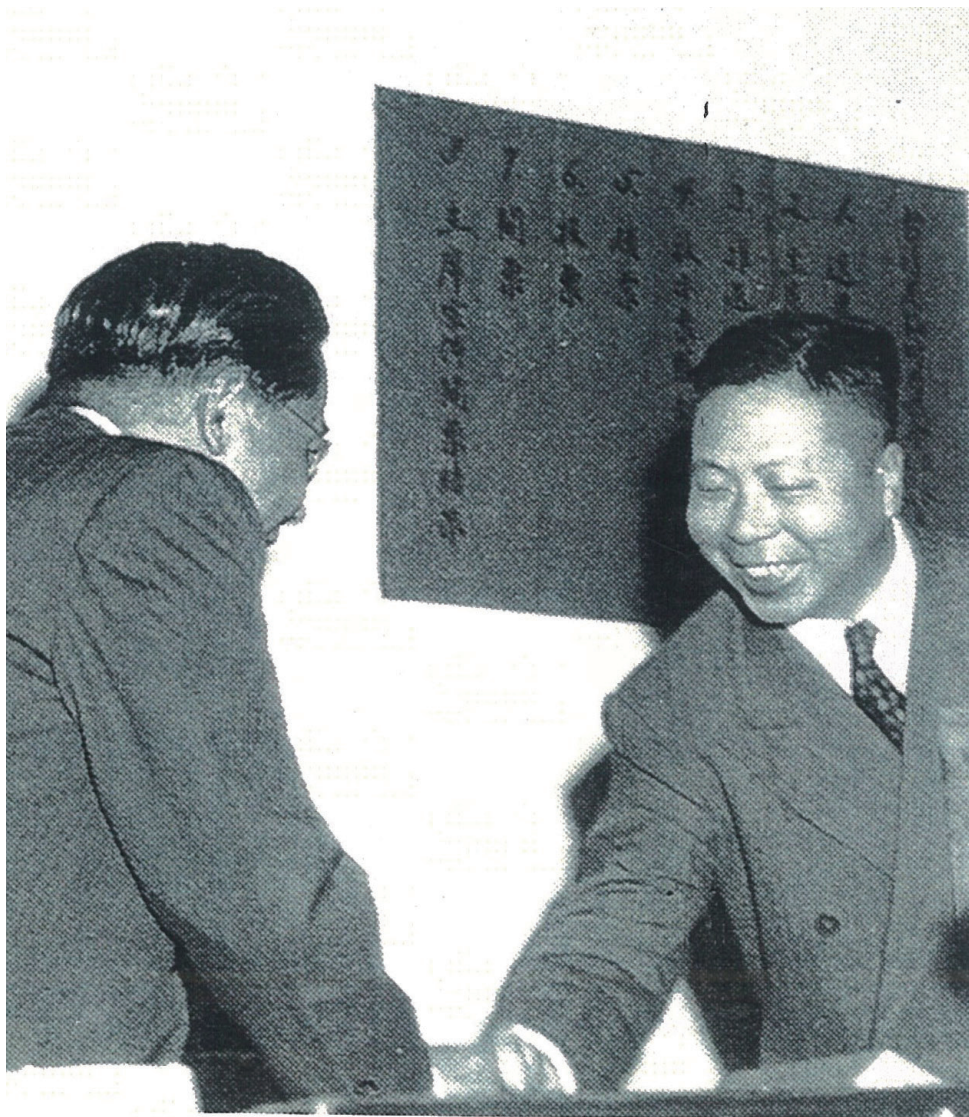
面向鏡頭者為吳國楨主席