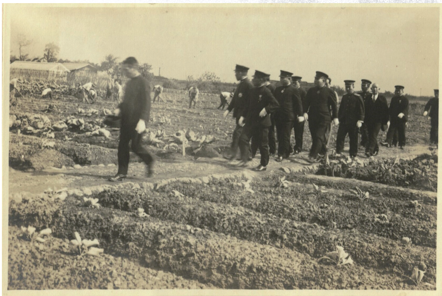
長谷川總督視察本校農場作業情形

民國 30 年（昭和 16 年）3 月 18 日第 18 任長谷川清總督巡視蘭陽地區，本次隨行人員有秘書官安住義一、總督府地方課長清水、保安課長下村鐵男等，長谷川總督在巡視宜蘭醫院後蒞臨本校，聽取深谷校長的簡報並視察本校農場，參觀學生的作業情形。