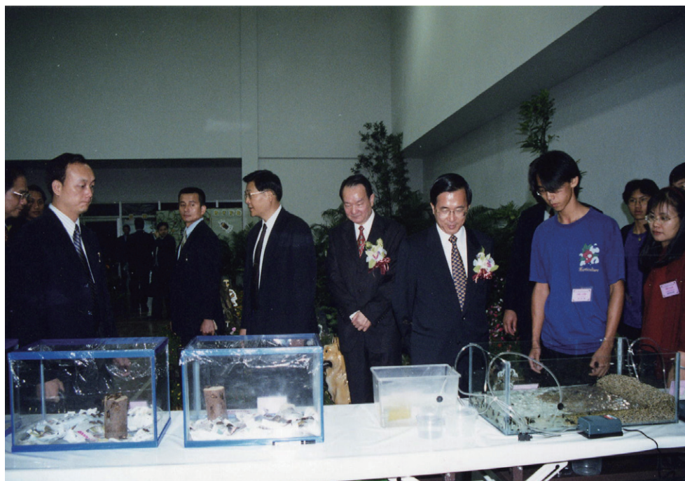
陳水扁總統參觀學生實習成果展