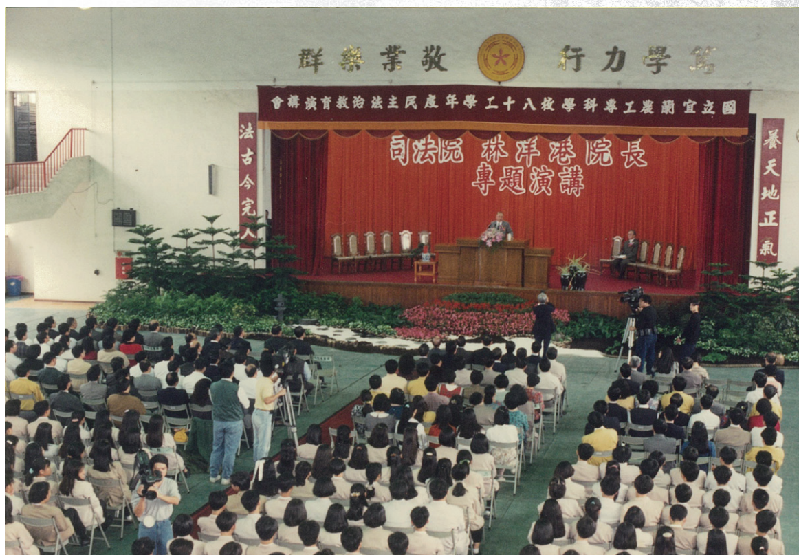
院長應邀來校專題演講