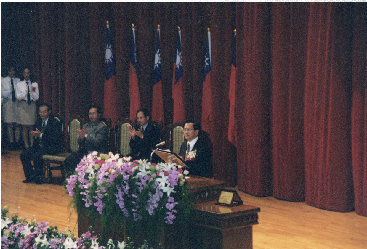
陳總統蒞校演講，並祝願本校 91 學年度順利改制為大學。

陳水扁總統蒞校演講，並祝願本校於 91 學年度順利改制為大學。會後參觀學生實習成果展，中午並與校友會理監事及本校一級主管一起用餐，餐畢搭乘 下午 1 點 35 分 的火車離開宜蘭。