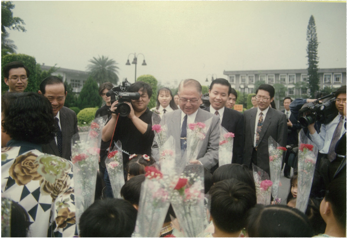
院長接受托兒所小朋友獻花