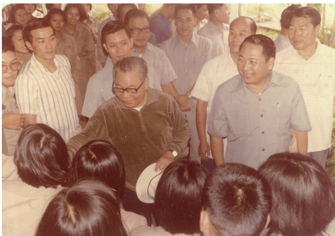
蔣總統與學生們握手寒暄，展現親和力。