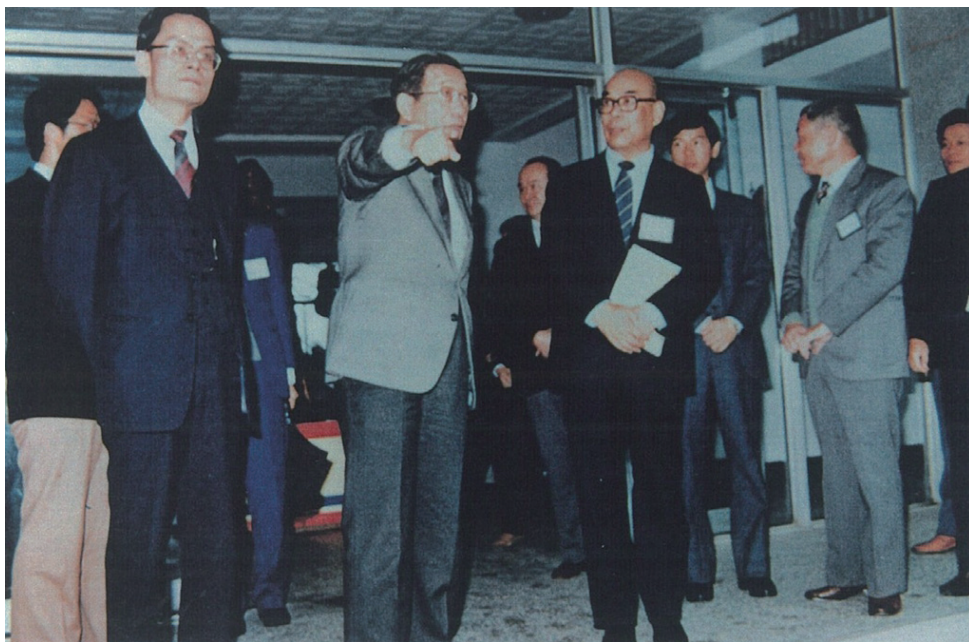
教育部長李煥（提手者）率省教育廳長林清江及技職司長楊朝祥蒞校，部長左側為于延文校長。

教育部長李煥率省教育廳長林清江及技職司長楊朝祥蒞校瞭解升格專科學校條件。返部後立即發布：宜蘭農工適宜改設專科學校。（行政院核定本校升格專科學校時，李部長已升任行政院長）