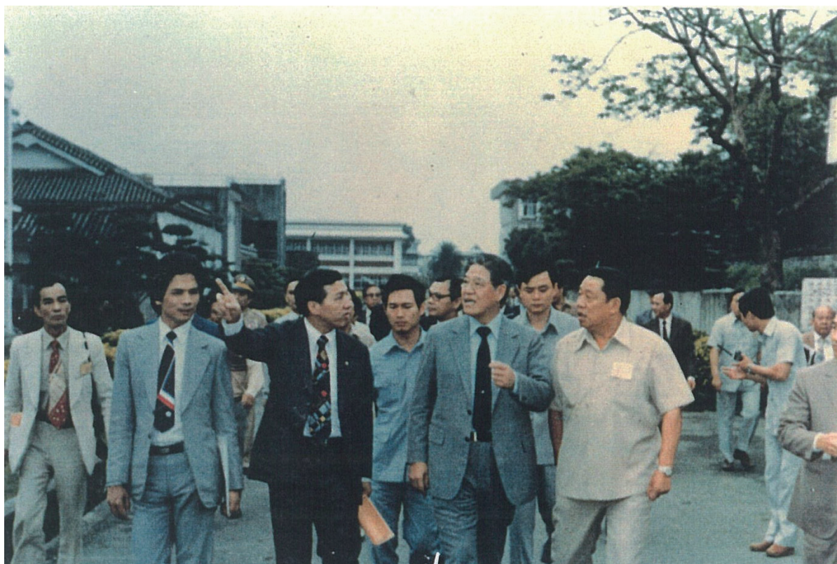
嚴太煒校長陪同來賓巡視校區，前排右起分別為：校長、李登輝省主席、陳洎汾省議員及游錫堃省議員。