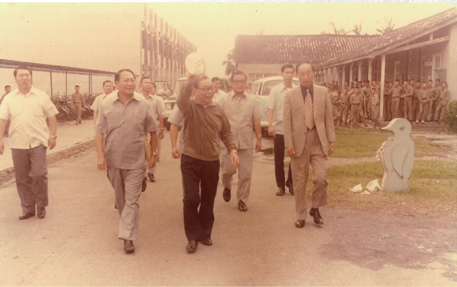
蔣總統繞行至實習場、教室區、並向學生揮手致意。