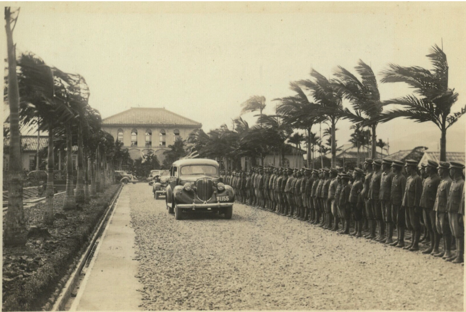
長谷川總督視察本校校門前列隊情形

民國 15 年（昭和元年）9 月 1 日第 11 任上山滿之進總督到訪，校方至車站迎接上山總督，下午 2 點來校巡視。民國 17 年（昭和 3 年）10 月 7 日第 12 任川村竹治總督巡視本校，校方在車站及校門口列隊歡迎，總督在本校約視察 15 分鐘。民國 18 年（昭和 4 年）10 月 2 日舉行第 1 屆運動會，第 13 任石塚英藏總督到校巡視。民國 30 年（昭和 16 年）3 月 18 日第 18 任長谷川清總督巡視蘭陽地區。